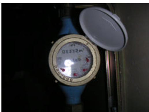
Vattenmätaravläsning (5372 m 3 )