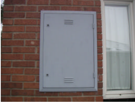
Elmätarskåp på fasadväggen.