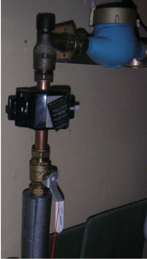
Huvudavstängningred för vatten i huset.